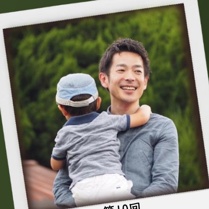
第10回 「ベスト・プラウド・ファーザー賞in関西」 特別部門で表彰

TEL：050-7105-8056 FAX：072-851-9335 E-mail： pta.hirakatashi@gmail.com